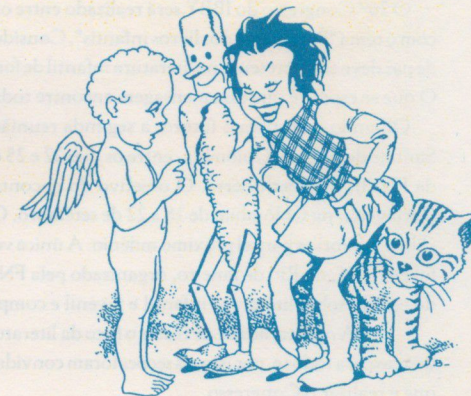
Ilustração de André Leblanc