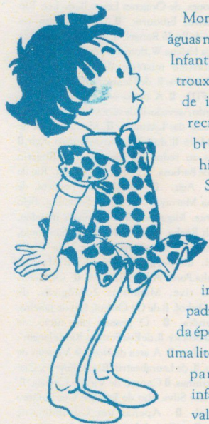
Ilustração de Manoel Victor Filho

E como diz o crítico Wilson Martins: "Lobato foi no campo da ação e das idéias sociais, econômicas e políticas, o praticante mais sistemático e característico do movimento modernista". E agora ele ressurgiu novamente, através desta publicação é de outras que foram lançadas recentemente, citadas a cima. Entretanto, o meio editorial, continua a dever-nos, uma mais do que oportuna reedição do fundamental Monteiro Lobato - Vida e Obra , de Edgard Cavalheiro.