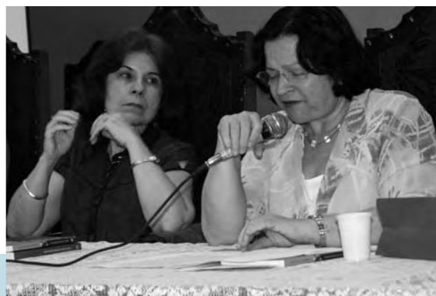
Goiânia – Goiás.