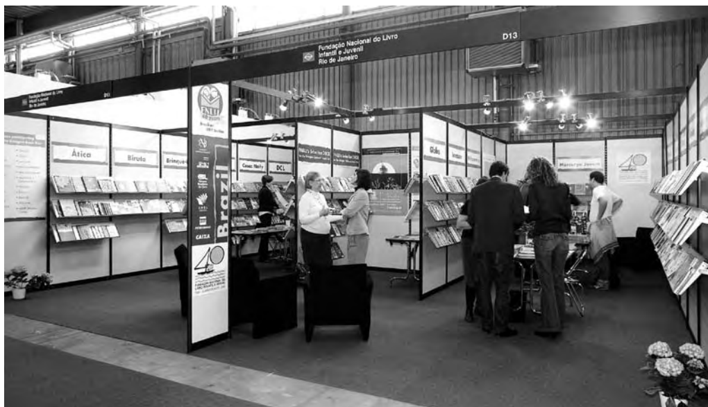
Estande brasileira na Feira de Bolonha.