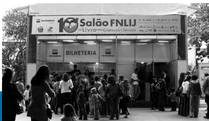
Entrada do 10º Salão FNLIJ.