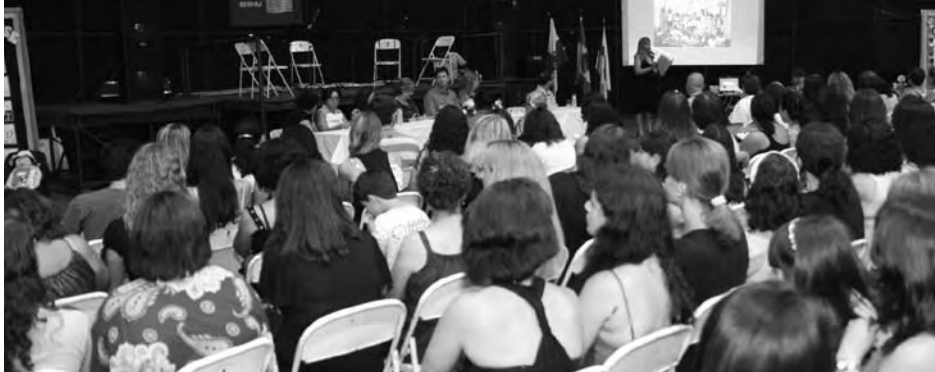
Abertura do 6º Momento Literário de Barra Mansa.

Pelo terceiro ano consecutivo a Fundação Nacional do Livro Infantil e Juvenil foi convidada para coordenar os espaços destinados à leitura e de bate-papo com escritores e ilustradores. Como nos moldes do Salão FNLIJ do Livro, foram montadas a Biblioteca FNLIJ para Crianças e Jovens e o Espaço FNLIJ de Leitura. Desde a 4ª edição, a Fundação é responsável também por indicar os palestrantes da abertura que conversam com os professores.