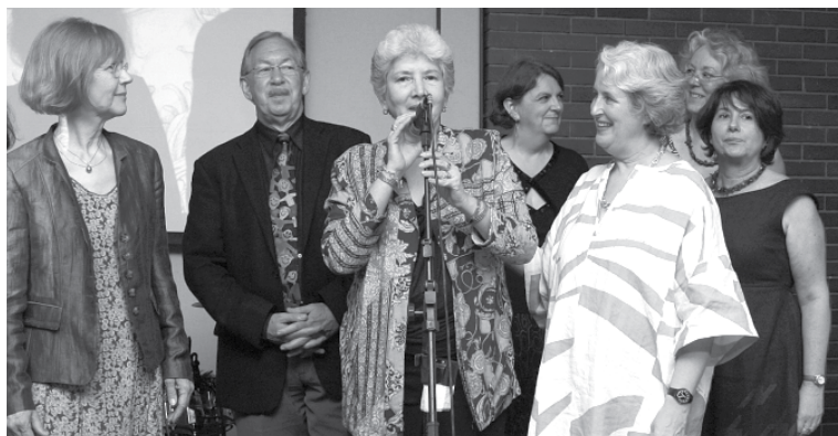
Staff internacional do IBBY na festa dos 40 anos da FNLIJ.