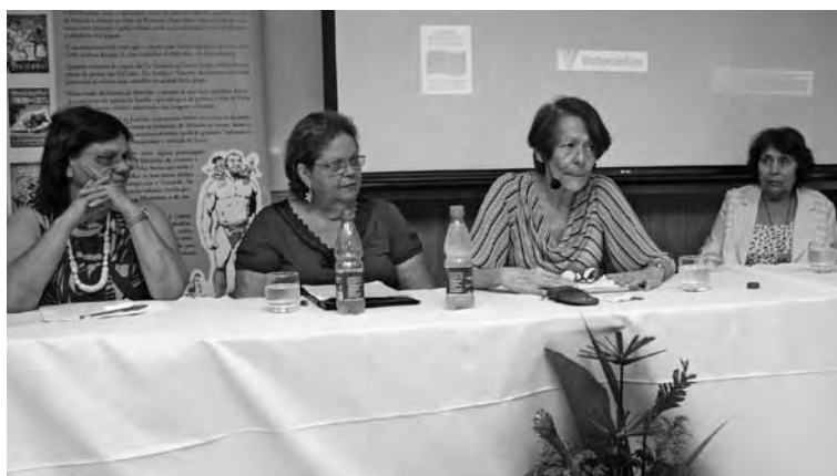
Projeto Caravana da Leitura Monteiro Lobato. João Pessoa - Paraíba