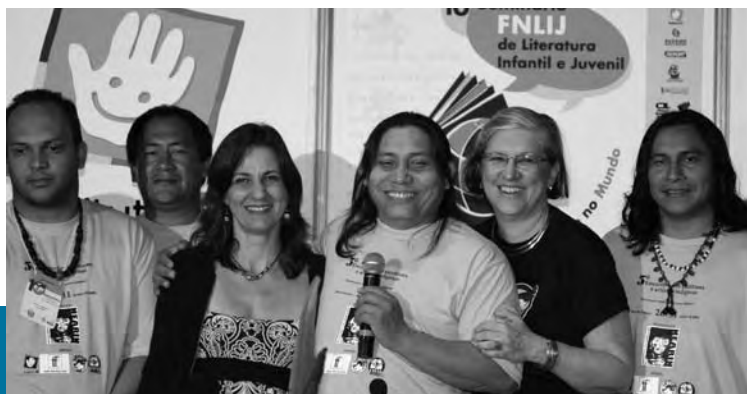
Encontro dos escritores indígenas no 10º Seminário FNLIJ de Literatura Infantil e Juvenil.