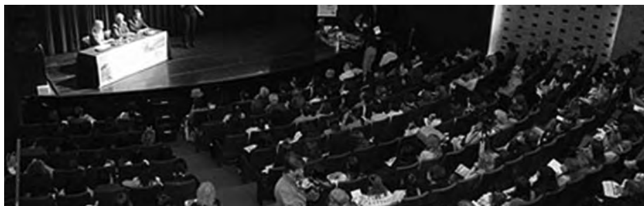
Uma das plenárias do Seminário Internacional Placer de Leer.

Para conhecer melhor o projeto, visite o site: www.vadoascuola.org .