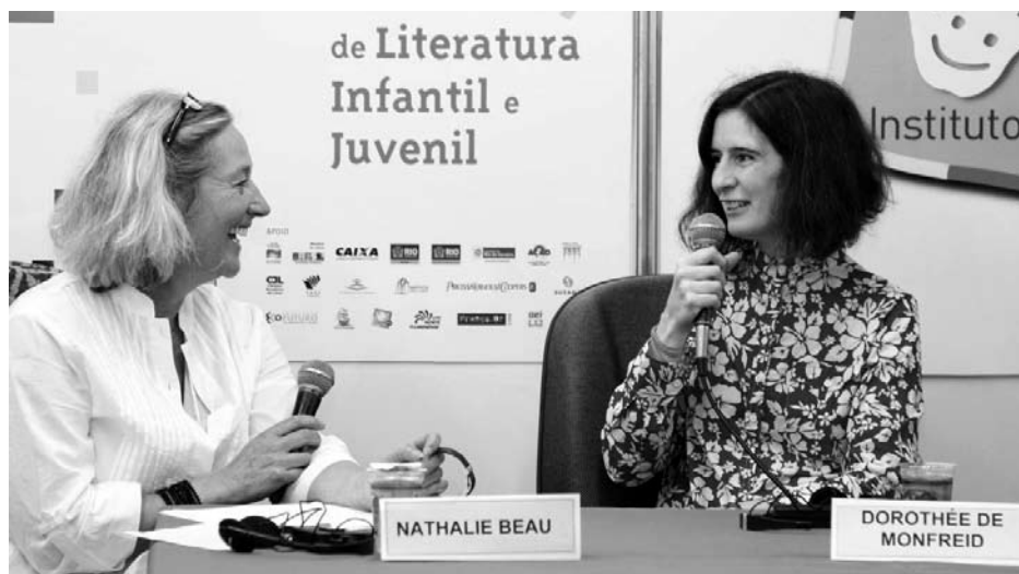
Francesas participaram do primeiro dia no 11º Seminário FNLIJ