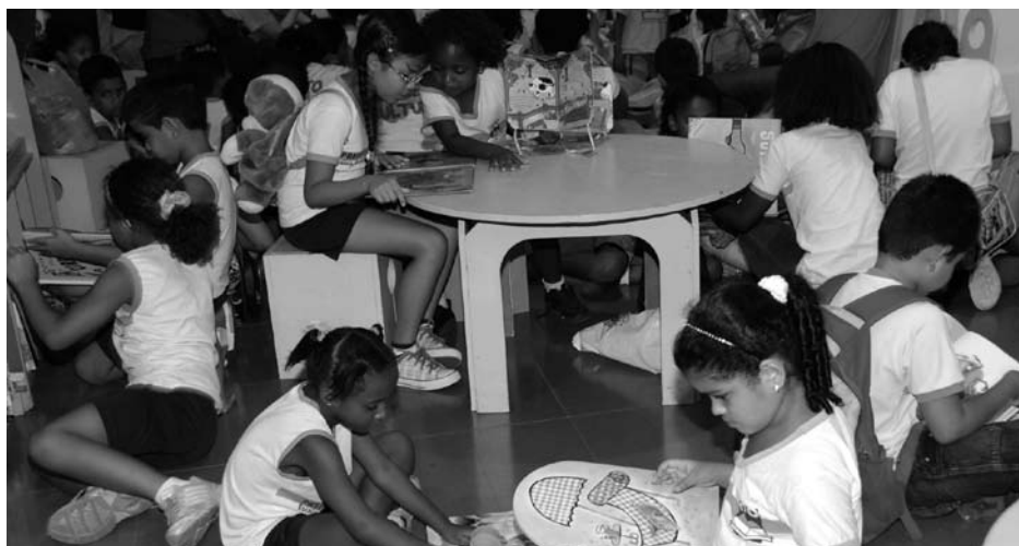
A 4ª edição do Natal com Leituras recebeu mais de 2.800 visitantes

A FNLIJ promoveu também encontros para a formação de educadores que aconteceu nos dias 24 e 26/11, às 17h. No primeiro dia, a ilustradora Graça Lima entrevistou o escritor Bartolomeu Campos de Queirós e o ilustrador Roger Mello. Neste dia, o Natal com Leituras , recebeu a visita dos representantes dos comitês do Proler de todo o Brasil que se reuniam no auditório Machado de Assis - Espaço Eliseu Visconti – para o Encontro Nacional do