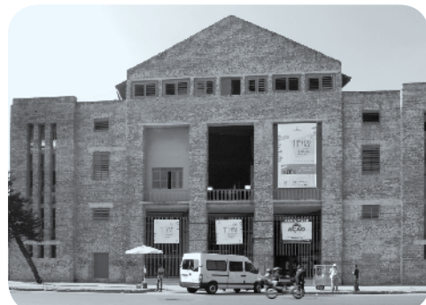
Centro Cultural Ação da Cidadania, novo local do Salão FNLIJ

Neste Notícias 2 você encontra uma Retrospectiva de 2009 das ações da FNLIJ.