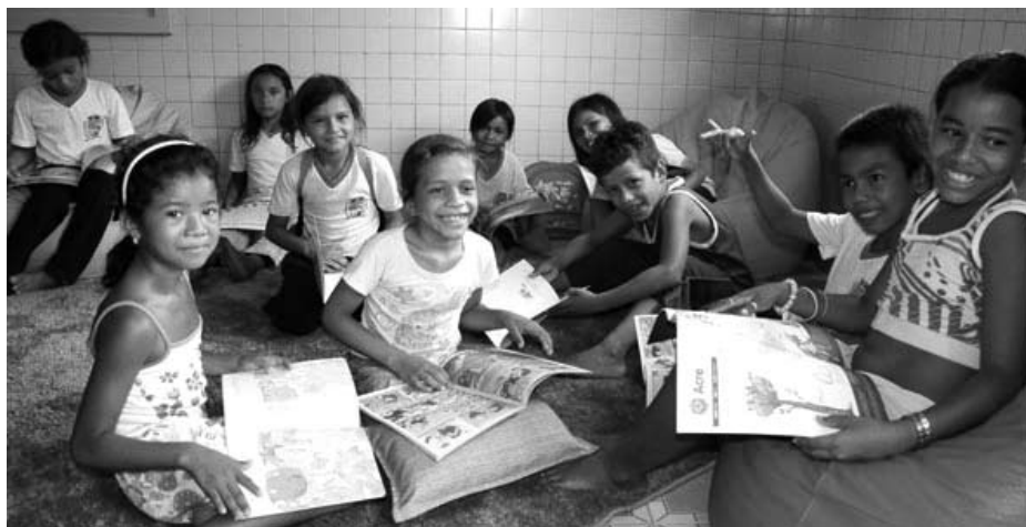
Crianças se divertem com livros e leituras na Biblioteca Comunitária Ler é Preciso.