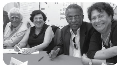
Os escritores Ziraldo, Ruth Rocha, Joel Rufino dos Santos e Ana Maria Machado homenageados no 11º Seminário FNLIJ