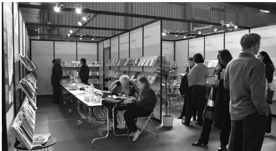
Estande organizado pela FNLIJ na Feira de Bolonha, Itália