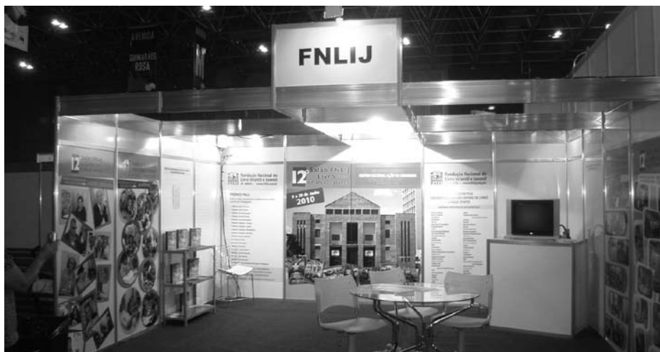
Estande da FNLIJ na XIV Bienal do Livro do RJ

A 1ª Feira do Livro Indígena de Mato Grosso – FLIMT aconteceu durante os dias 06 e 10 de outubro, na Praça da Re-