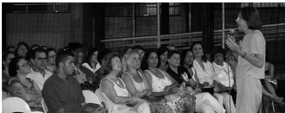
Marina Colasanti em excelente palestra de abertura do VII Momento Literário de Barra Mansa para um público de mais de 600 professores

Além do apoio financeiro, as escolas vencedoras terão acompanhamento técnico e a oportunidade de divulgar suas ações (no caso do RJ o acompanhamento técnico da FNLIJ será para as 17 escolas selecionadas e não só para as sete vencedoras), uma viagem para à Colômbia e espaço para apresentar seu projeto no Salão FNLIJ , em 2011.