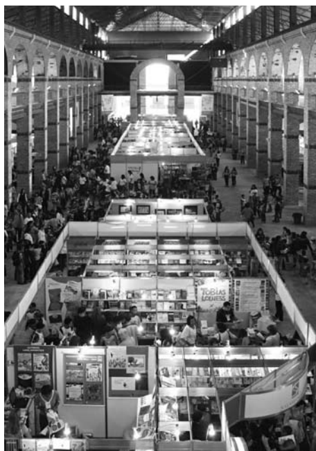
70 editoras e mais de 40 mil pessoas participaram do 11º Salão FNLIJ

Lei Rouanet, e importantes apoios como da Prefeitura do Rio de Janeiro, por meio da Secretaria Municipal de Educação, Abrelivros, Caixa Econômica Federal, Câmara Brasileira do Livro, Consulado Geral da França, Instituto C&A, Instituto Ecofuturo, Instituto Pró-Livro, PriceWaterhouseCoopers, Sindicato Nacional dos Editores de Livros, Suzano Papel e Celulose e Usina Termoeletrica Norte Fluminense.