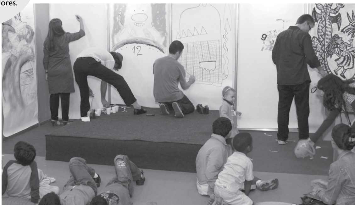
Ilustradores no momento da Performance que neste ano acontecerá no estande da Petrobras