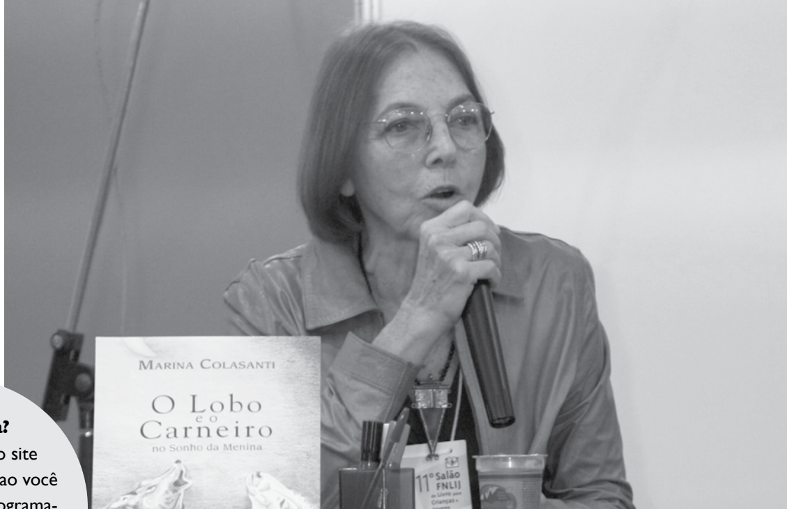
A escritora Marina Colasanti na Biblioteca FNLIJ do Educador, na edição do ano passado, conversando com o público sobre seus livros.

Que acessando o site www.fnlij.org.br/salao você encontra toda a programação deste 12º Salão FNLIJ, além de informação sobre as edições anteriores.