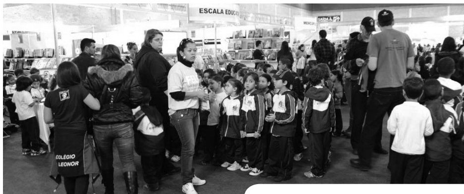
A 1ª FELIT/SBC recebeu mais de 80 mil pessoas.

Um Notícias Especial sobre a 1ª FELIT/SBC foi elaborado e será enviado aos municípios com mais de 500 mil habitantes, divulgando o trabalho da instituição e a realização de um evento dessa magnitude, visando multiplicar a experiência.