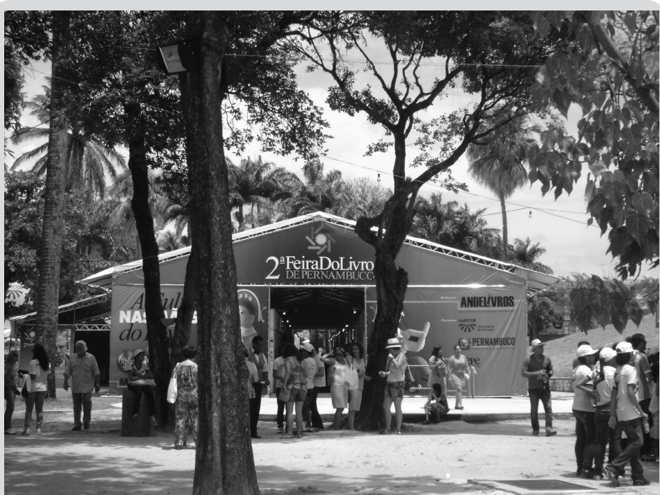
Feira Literária de Pernambuco, na qual a FNLIJ esteve representada.