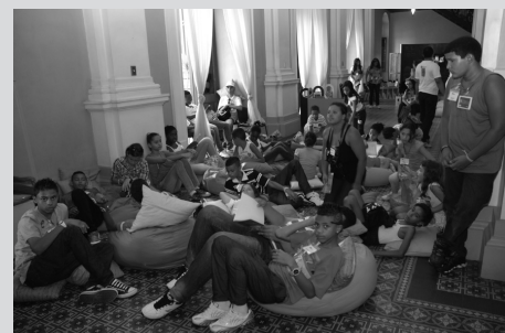
Crianças lendo durante atividades no Natal com Leituras na Biblioteca Nacional.