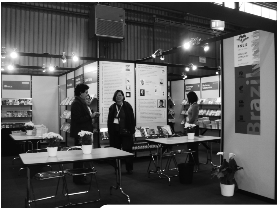
Estande brasileiro organizado pela FNLIJ na 48ª Feira de Bolonha.