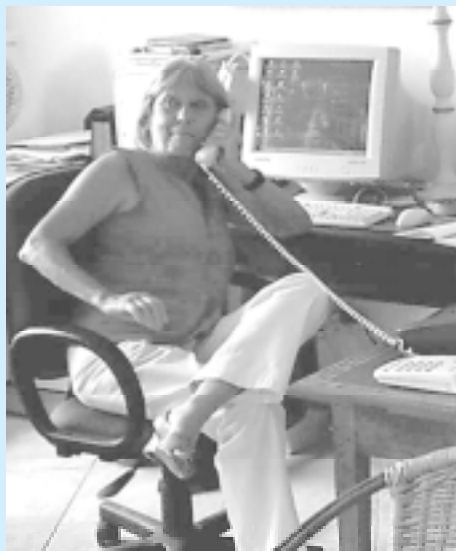
Na Casa Lygia Bojunga, em Santa Tereza, Rio de Janeiro, a autora recebeu vários telefonemas, do Brasil e do exterior, congratulando-a por ter sido a única vencedora do Prêmio ALMA.

L. B.: Tenho enlouquecido cada vez menos. Estou aprendendo muita coisa. Essa experiência realmente tem me enriquecido muito. E até parti para um tipo de criação diferente. Estou escrevendo textos em que eu conto episódios relacionados à história de cada livro meu. Muitas vezes interrompi leituras de livros, para imaginar a história do objeto livro: o que rolou, por onde ele andou, o que foi preciso fazer para ele chegar aqui ou lá. Sempre gostei de ficar imaginando isso. E agora, estou incluindo nas novas edições dos meus livros, publicados pela Casa, esses depoimentos num capítulo extra chamado “Pra você que me lê”. Mas agora já estou sentindo falta dos meus personagens.