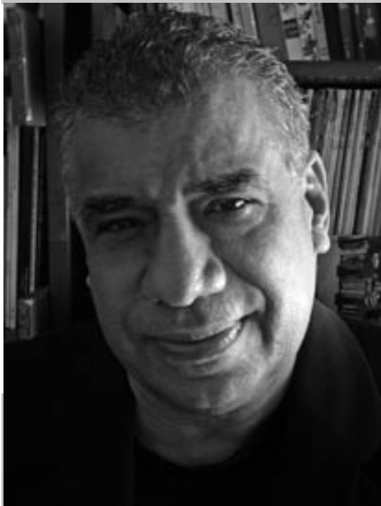
Rui de Oliveira (Ilustrador)

Conheça tudo sobre o Prêmio Hans Christian Andersen no site: http://www.geocities.com/gotefridus/andersen2006index.html