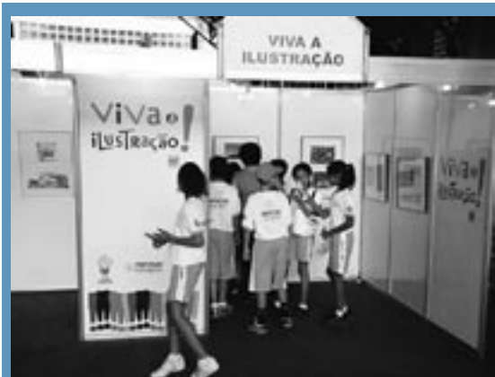
Crianças visitando a exposição “Viva a Ilustração” e lendo livros num dos estandes da Bienal.

mil estudantes da rede municipal de educação de Nova Iguaçu e quatro mil de estabelecimentos particulares, públicos estaduais e de outros municípios, numa demonstração de que livros bons e gente lendo, juntas, é uma grande atração para qualquer criança ou jovem. ■