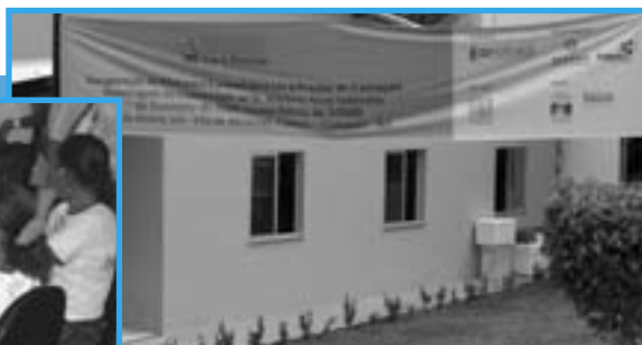
Biblioteca Comunitária Ler é Preciso de Camaçari, Vila dos Abrantes, BA.

A 4ª edição desse programa de grande sucesso entre as crianças e entre os adultos também, já premiado internacionalmen-