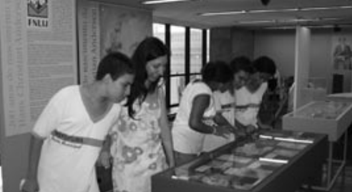
Exposição Sob o domínio da imaginação , realizada na Academia Brasileira de Letras.

cedoras do Prêmio Andersen do IBBY, foram homenageadas e estiveram presentes na inauguração da exposição. • No jornal Notícias , informativo mensal da FNLIJ, foi criada uma coluna específica para o Bicentenário de Andersen, divulgando eventos realizados em escolas, centros culturais, bibliotecas, bem como projetos, exposições, seminários, premiações, lançamentos de livros, publicações e diversas outras homenagens a Andersen, no Brasil e no mundo. • Também foram publicados, no nosso informativo, textos sobre este escritor e sua obra, de autoria de escritores e especialistas em literatura: “A magia de Andersen”, da escritora Lygia Bojunga; • “Sob o domínio da imaginação”, artigo do acadêmico Cícero Sandroni; • Hans Christian Andersen: muito mais que simples contos de fadas , ensaio elaborado por Janice S. Eitelgeorge e Nancy A. Anderson, da University of South Florida. • No Notícias 4 e no site da FNLIJ foi divulgado o pôster do IBBY em homenagem ao Bicentenário de Hans Christian Andersen, de Martin Waddell e Max Velthuijs (vencedores do Prêmio HCA em 2004).