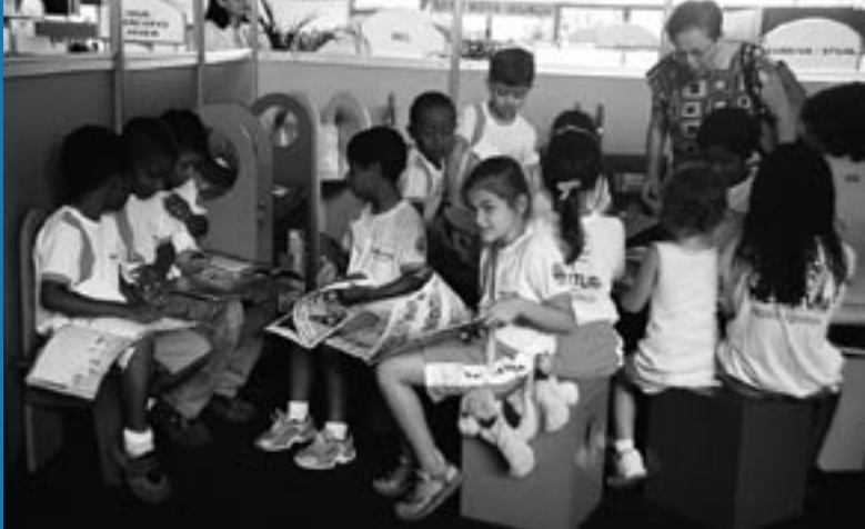
Alunos das escolas municipais de Nova Iguaçu, na Biblioteca FNLIJ.